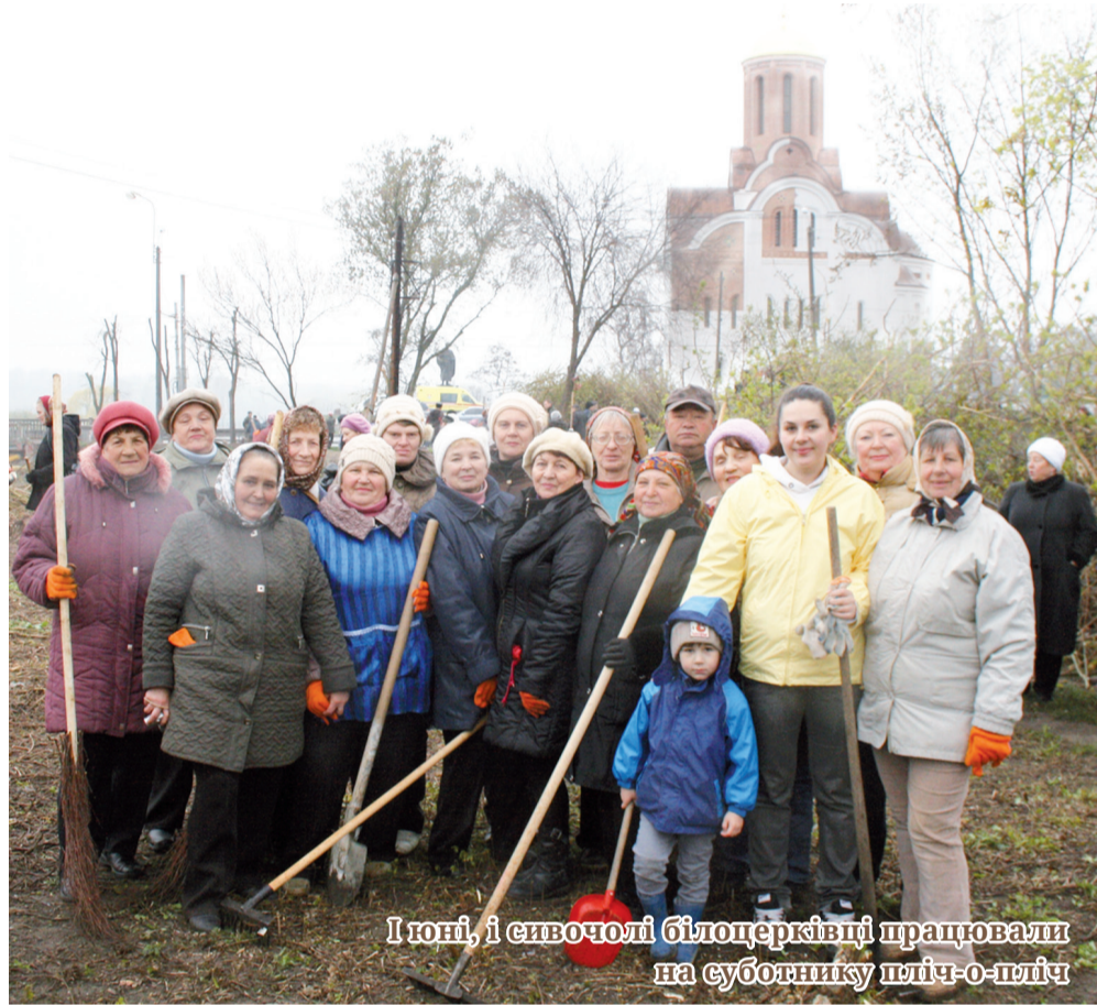
І туди, і сивочолі білоцерківці працювали на суботнику пліч-о-пліч

У нас, українців, упродовж багатьох років склалася гарна традиція: напередодні Великодніх свят прибирати, чепурити не тільки власні помешкання, прибудинкові території, а й ті куточки міста, де любляємо відпочивати з дітьми, друзями, своїми гостями. А коли на таку толоку масово виходять небайдужі люди, які не звикли нарікати на долю й постійно шукати винних, то відчуваєш неймовірне єднання на ґрунті звичайного людського прагнення бачити місто по-європейськи чистим і затишним.