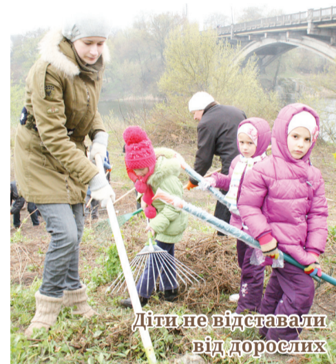
Діти не відставали від дорослих

А як завзято й старанно працювали на суботнику юні білоцерківці – ті, кого не злякала дощова погода,