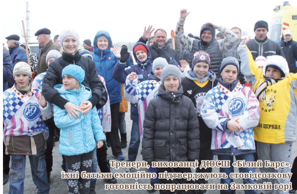
Тренери, вихованці ДЮСШ «Білий Барс», їхні батьки емоційно підтверджують стовідсоткову готовність попрацювати на Замковій горі

ті, кого змалечку мудрі батьки привчають до суспільно корисної праці. Адже діти, дивлячись на дорослих, починають усвідомлювати свою громадянську місію, відчуваючи власну відповідальність за майбут-